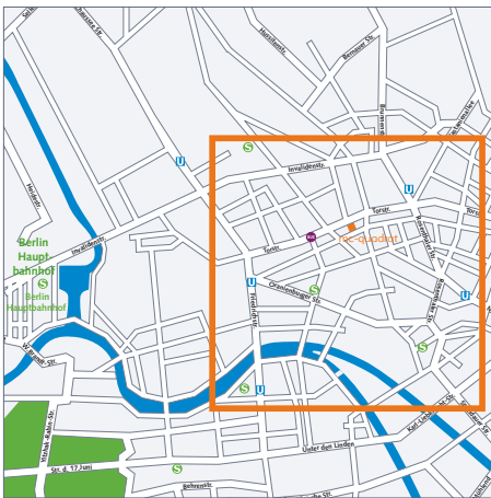
Entfernung: mc-quadrat zum Hauptbahnhof

Fahrtzeit: ca. 10 Min. Einzelfahrt Tarifbereich AB: EUR 2,30. Anfahrt mit dem Taxi: EUR 7,00.